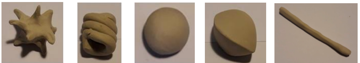
Image: Expérimentation de différentes formes en argile

A la fin, les formes obtenues sont exposées. En petits groupes, les enfants échangent sur les formes créées, ce qu'elles peuvent représenter et à quoi elles pourraient servir pour le personnage qu'ils vont modeler.